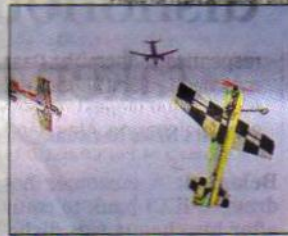
GIVING WINGS TO DREAMS

The Aerophilia 2017 airshow performed by Abdullah Jaseem is open to the public and all students on Friday. The air show will provide a multitude of learning experi-